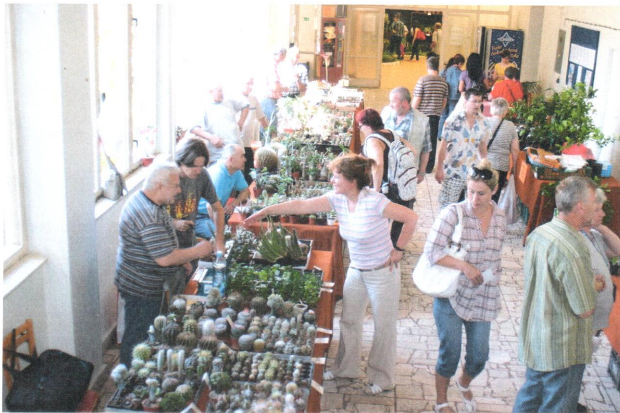
Priestor umiestnenia stánku SMZ na chodbe v priestoroch Botanickej záhrady UPJŠ (snímka z minulosti).